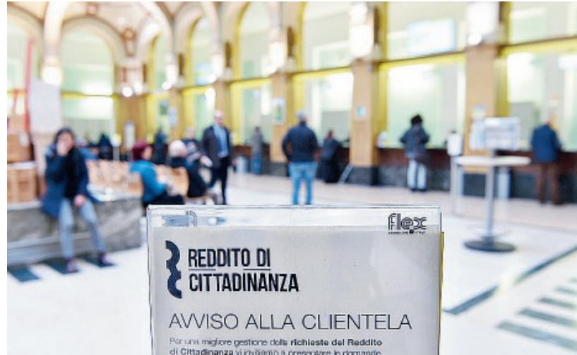
In calo i percettori di Reddito di cittadinanza

Per il Reddito di emergenza sono state erogate nel complesso oltre un milione e mezzo di mensilità. I nuclei