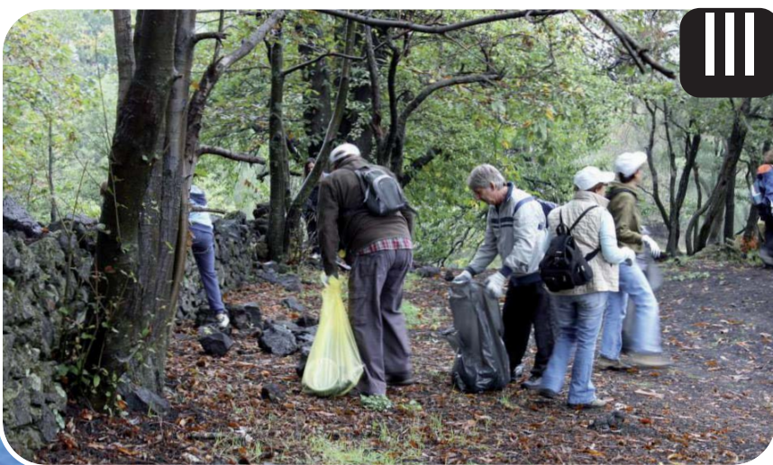
A sinistra un suggestivo scorcio dell'Etna; sopra, un gruppo di volontari durante le operazioni di pulizia a Milo Pietracamone nel corso della giornata "Megli Parco, che sporco" durante la quale sono state raccolte oltre 25 tonnellate di rifiuti