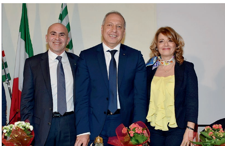
SEGRETERIA UST CISL CATANIA

In Sicilia, oggi, metà della popolazione è a rischio di povertà o esclusione sociale: sono comparsi nuovi poveri, i working poor, lavoratori diplomati o laureati che, con la crisi, hanno subito un cambiamento della condizione economica. L'emigrazione verso il Nord ha riguardato il 70% di giovani e il 30% di laureati. Per la Cisl catanese, la sfida è riuscire a guidare la trasformazione del mondo del lavoro, perché torni possibile progettare un futuro non solo per i giovani, ma anche per i