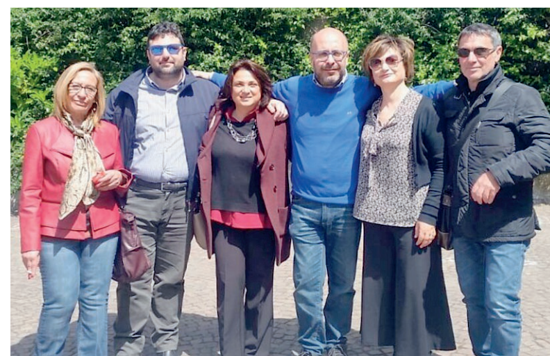
LA SEGRETERIA PROVINCIALE DELLA CGIL DI CATANIA

Ma da dove cominciare? «Dal dialogo e dal confronto quotidiano con i cittadini. Dobbiamo continuare a spiegare cos'è la Carta: non c'è altra strada se vogliamo arrivare a un risultato concreto» risponde Rota. La "Carta" è il nuovo Statuto dei lavoratori redatto dalla Cgil nazionale in 97 articoli, basato sul principio che i