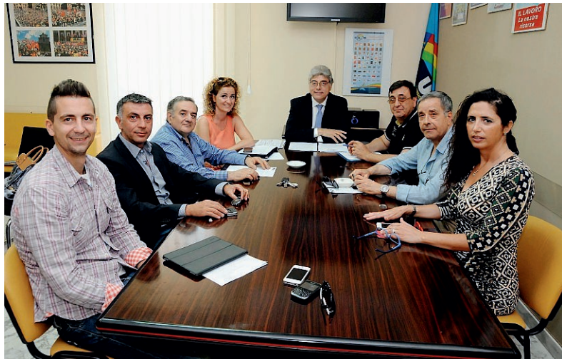
LA SEGRETERIA PROVINCIALE UIL

«Mai come ora - aggiunge Parisi - salvaguardia e progresso di una civiltà del lavoro sono vitali per una società in crisi di valori fondanti come la partecipazione, la tolleranza,