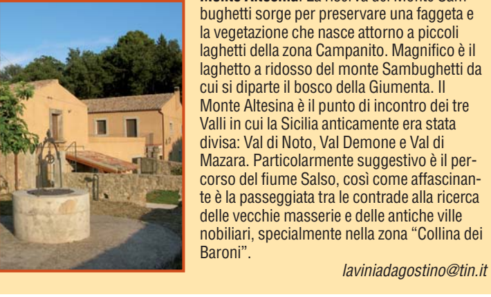
In basso, una fattoria fortificata del 1600

Fondata dai Bizantini sui monti Nebrodi ha subito numerose dominazioni che hanno lasciato un vasto patrimonio artistico che, insieme alle oasi naturalistiche, la rendono una meta unica